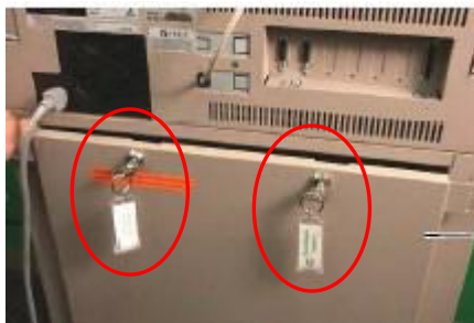
Face arrière de la Medstation