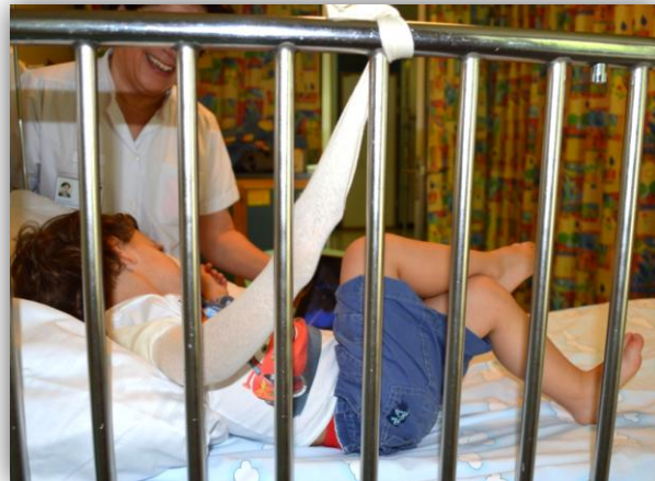
Extravasation au bras