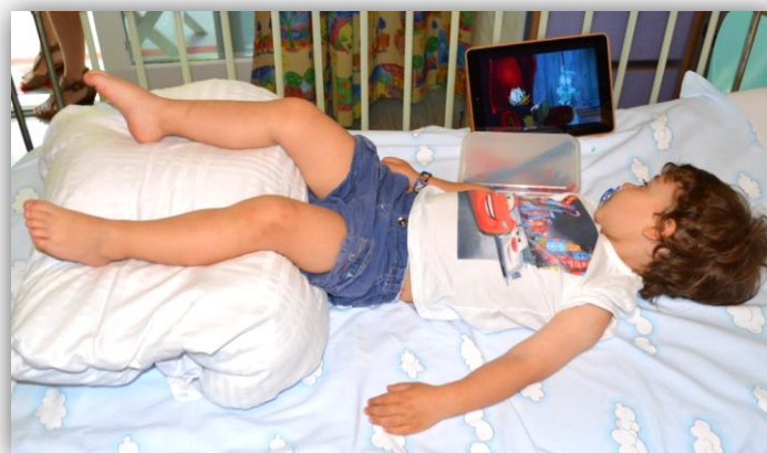
Extravasation au pied