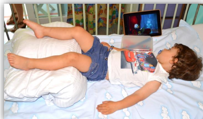
Extravasation au pied