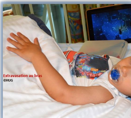
Extravasation au bras