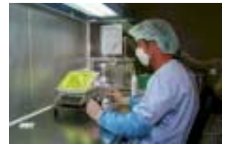
Préparation d'une APT