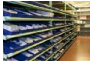
Le stock de médicaments