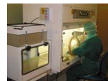
Fig 1: isolateur

La reconstitution des cytostatiques injectables est centralisée à la pharmacie des HUG depuis plusieurs années. Elle a lieu dans des isolateurs à pression négative situés dans des locaux de classe C (fig 1). L'aptitude des opérateurs de production à travailler de façon aseptique est évaluée annuellement à l'aide d'une validation par « media fill » (simulation de différentes préparations à l'aide de milieux de culture). Nous ne disposons en revanche pas de test permettant de démontrer l'absence de contaminants chimiques tels que des cytostatiques sur les préparations délivrées aux unités de soins ou sur les gants.