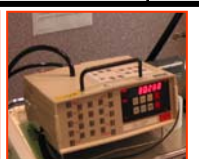
Compteur de particules