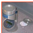
Impacteur d'air MAS100